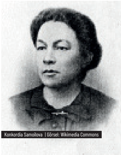
Konkordiya Samoilova