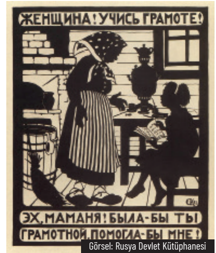
Görsel: Rusya Devlet Kütüphanesi