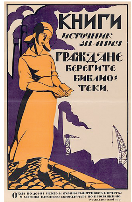
Görsel: Rusya Devlet Kütüphanesi