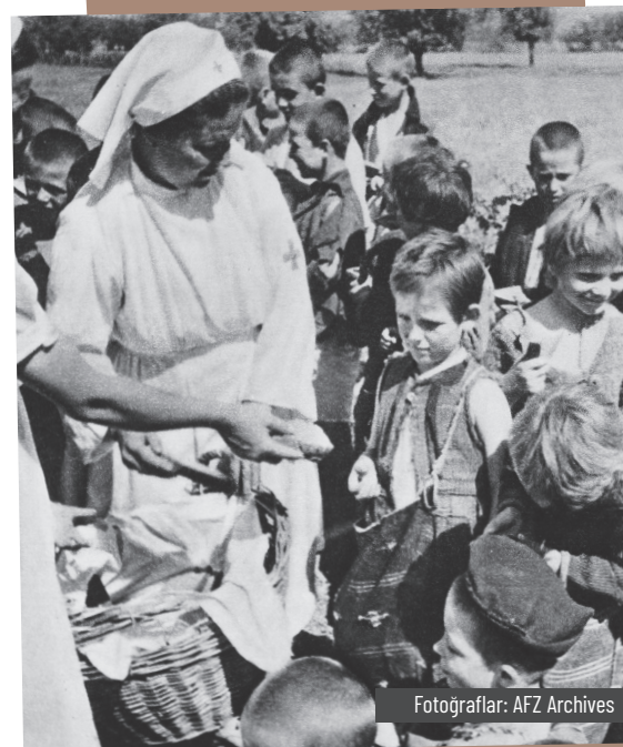
Fotograflar: AFZ Archives